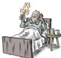
When we have symptoms, we contact the doctor only by phone