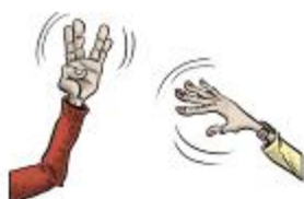
We greet without touching