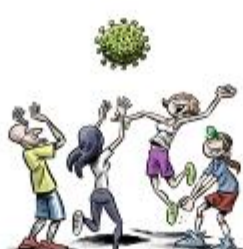
We don't create large groups, because that's where the virus spreads the easiest