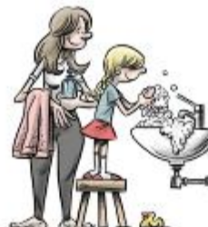
We grab the soap whenever we can