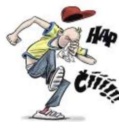
Bless you! We cough and sneeze exclusively into a tissue or a bent elbow