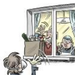
We help seniors with utmost care, because they are the most vulnerable