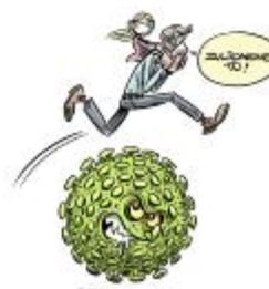
We know it's important to talk with kids. Even about the coronavirus