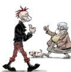
We wear masks to protect ourselves and others