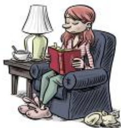
To fight the virus we stay at home